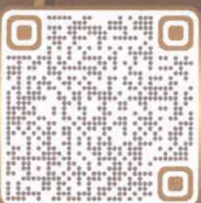
รายละเอียดเพิ่มเติม